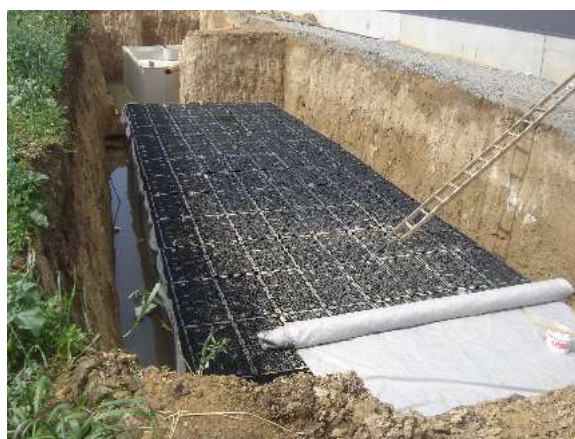
Vsakovací nádrž č.2: