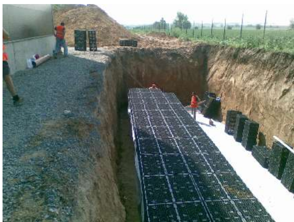
Vsakovací nádrž č.1:

Na tomto objektu je instalováno i dešťové odvodnění střechy podtlakovým systémem DYKA VACURAIN (14 střešních vtoků) a dále také KG potrubí DYKA SN4 a SN8